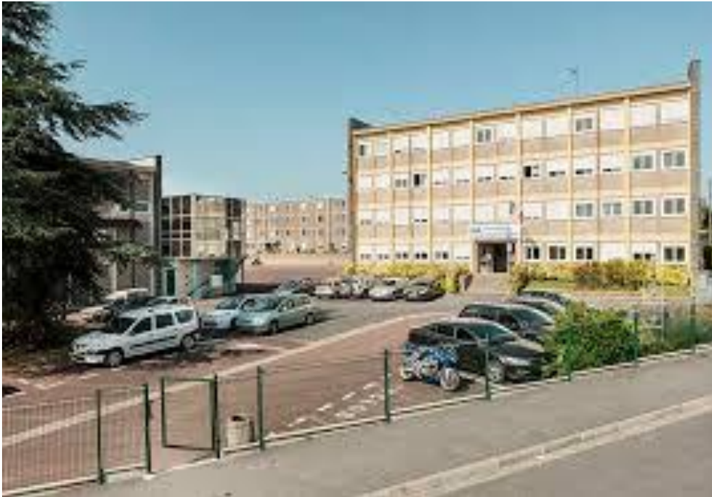
Site « la roquette »